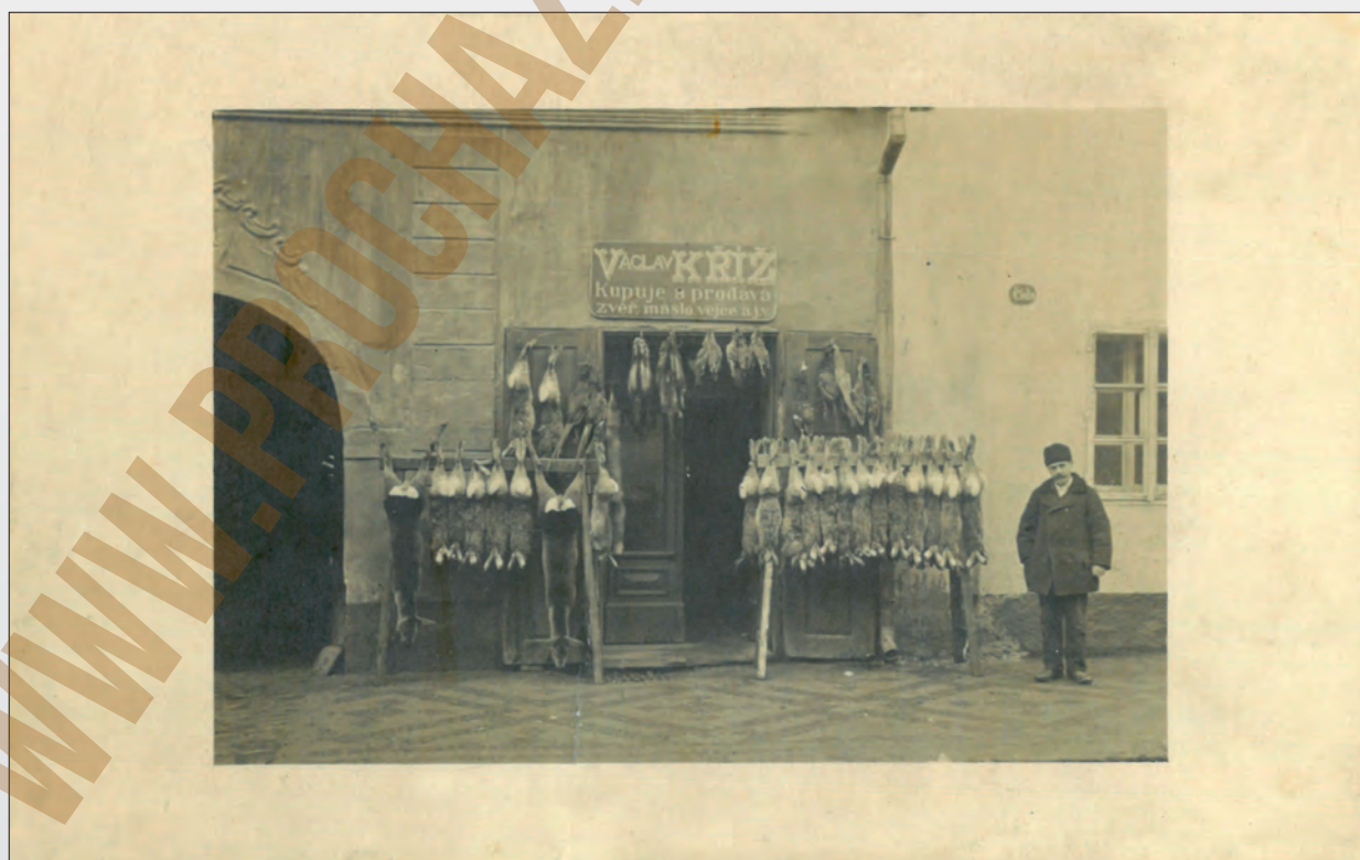
Vydali J. Šechtla a J. Voseček, Pelhřimov, F, 1912