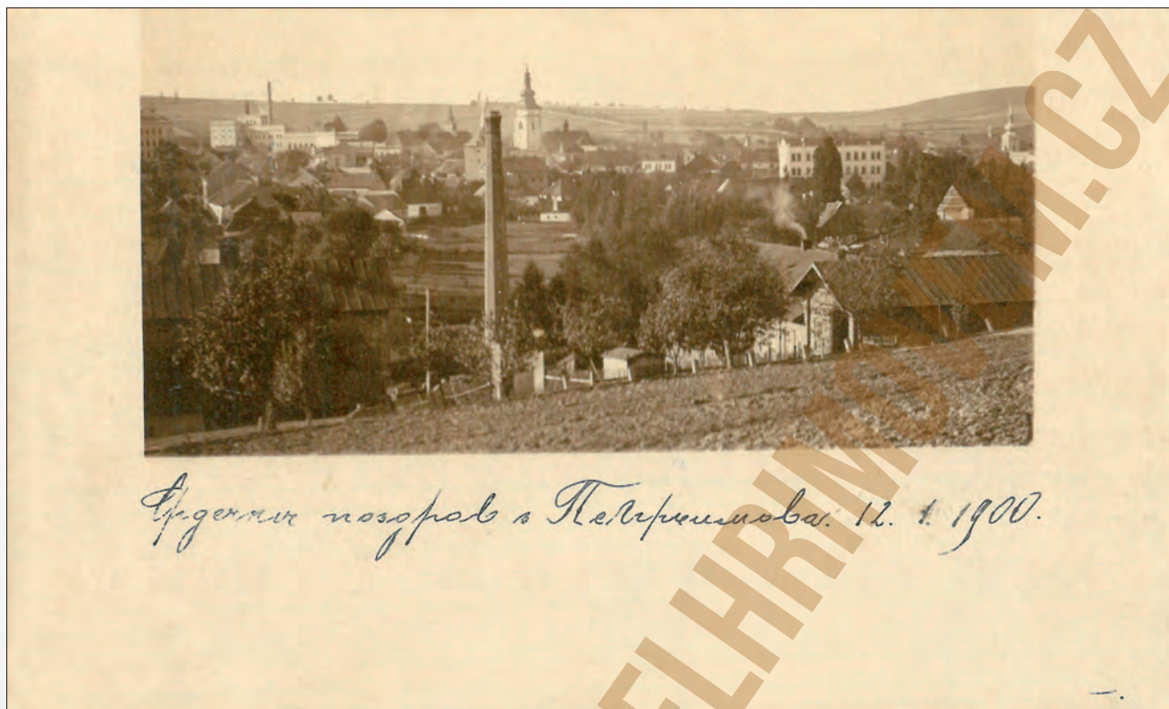
Vydavatel neuveden, DA, 1900s