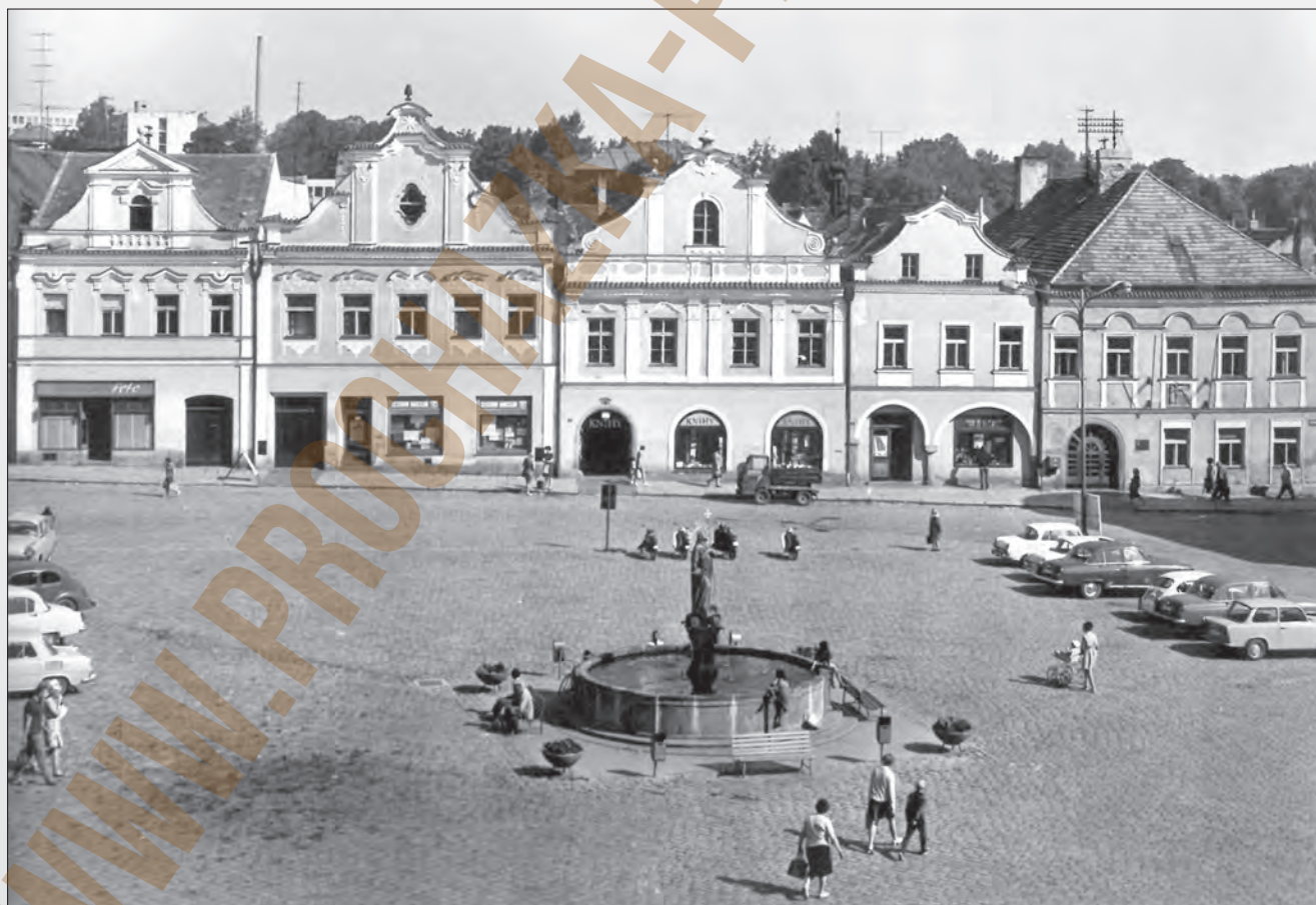
Vydal Orbis Praha, VF, 1972

Fotografování bylo pro děti novinkou a zajímavým zpestřením. Jistě je nemusel fotograf dlouho přemlouvat k pózování.