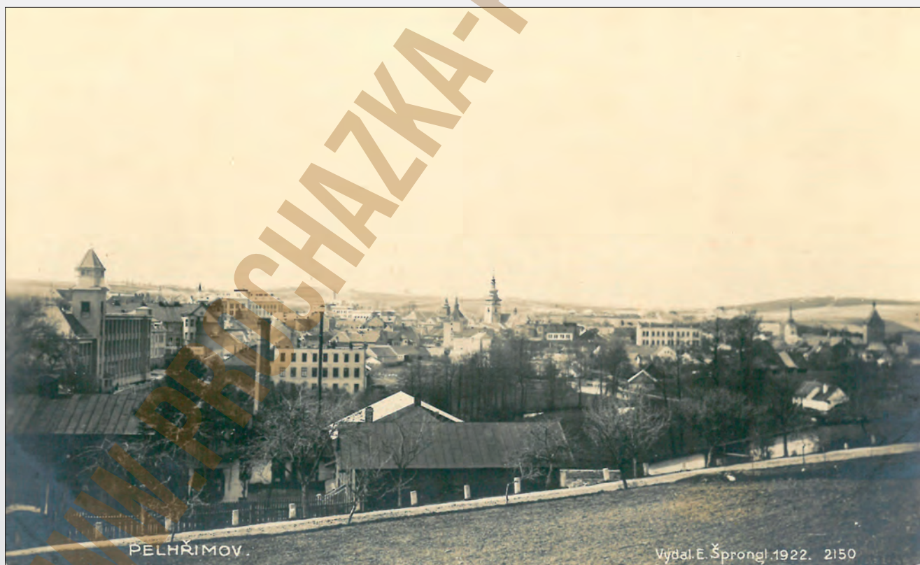
Vydal E. Šprongl, Pelhřimov, F, 1922

Škrobárna se mohla pyšnit prvním továrním komínem ve městě. Postupně se k němu začaly přidávat komíny u dalších továrních budov. Později v podobném pořadí naopak zase mizely.