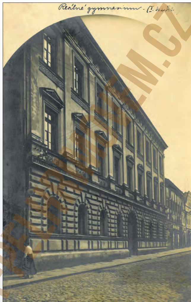
Vydali J. Šechtla a J. Voseček, Pelhřimov, F, 1921s