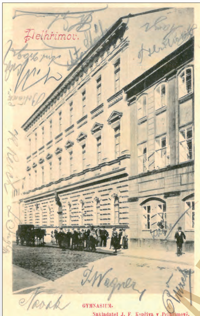
Vydal J. F. Kopriva, Pelhřimov, DA, 1901r