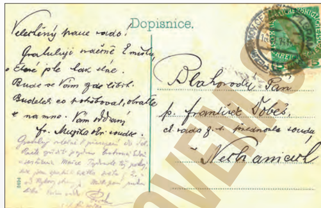
Obrazová a adresní strana pohlednice s krátkou adresou, 1914.

V poválečném období mizí mnohotvárné zpracování místopisných pohlednic a dochází k pozvolnému vytlačení tiskařsky různě provedených pohlednic jednodušší a hlavně levnější černobílou fotografií. Ta ve třicátých letech zcela ovládla oblast tvorby a vydávání místopisných pohlednic. Dostávají uniformnější vzhled, omezuje se počet námětů, ale díky fotografické technice je jejich zobrazení podrobnější a kvalitnější. V Pelhřimově se objevuje nová a ještě početnější vlna vydavatelů, zejména z řad trafikantů, papírníků, knihkupců a fotografů. Jejich celkový počet se rozrostl až na zatím doložených šestnáct i s již dříve vydávajícími: A. Hlavatá, V. Jelínek, F. K. Kořínek, A. Kott, R. Lerch, F. Marek, F. Paclík, A. Pacner, J. Pacner, J. Pejša, J. Švec (Praha), S. Račanský (Brno). Vedle toho vydávají pohlednice bez dalšího označení i tři největší firmy Foto-fon Praha, Fototypia Vyškov a Grafo Čuda Holice. Nabídka fotopohlednic byla tedy opravdu široká.