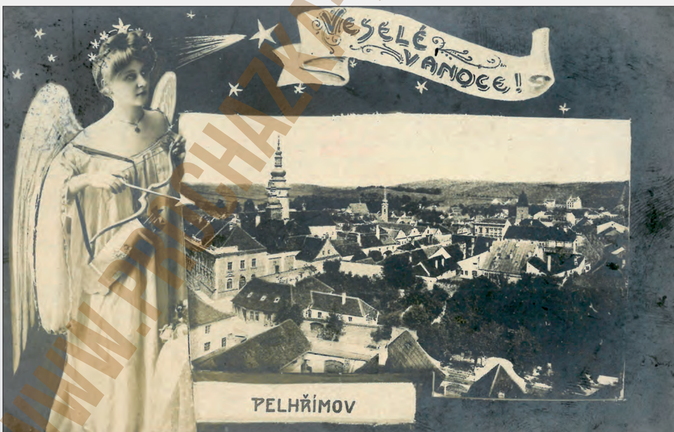
Vydavatel neveden, KA, 1909r

Netypický záběr z dívčích škol byl natolik zajímavý, že byl použitý i na fotokolážových pohlednicích.